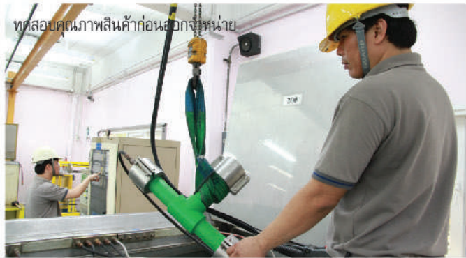
ทดสอบคุณภาพสินค้าก่อนออกจำหน่าย