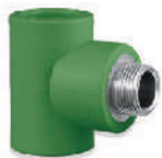
ข้อต่อสามทางเกลียวนอก* 20x1/2" - 32x1" มม.