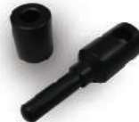
หัวเชื่อมแท่งเชื่อมพีพีอาร์ D7 - D11 มม.