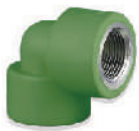
ข้องอ 90° เกลียวใน* 20x1/2" - 32x1" มม.