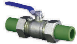
บอลวาล์วยูเนียน* 20 - 63 มม. (1/2" - 2")