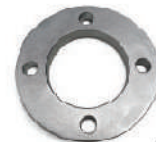
หน้างานเหล็ก 40 - 160 มม. (1 1/4" - 6")