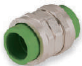
ข้อต่อยูเนียน* 20 - 32 มม. (1/2" - 1")