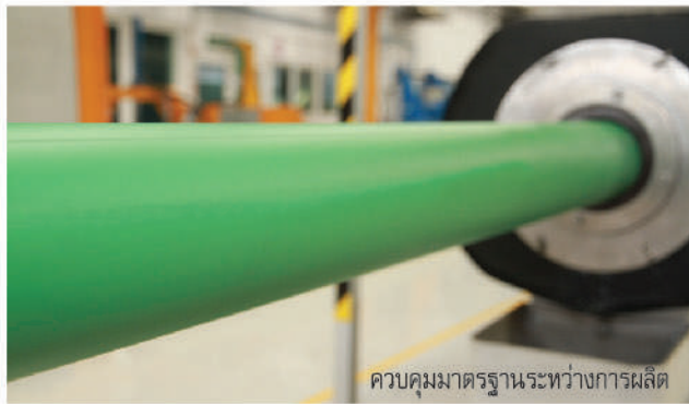
ควบคุมมาตรฐานระหว่างการผลิต