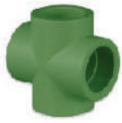
ข้อต่อสี่ทาง 20 - 50 มม. (1/2" - 1 1/2")