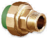
ข้อต่อยูเนียนเกลียวนอก ทองเหลือง 20x1/2" - 75x2 1/2" มม.