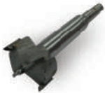
หัวเจาะอานม้าพีพีอาร์ 25 มม. (3/4")