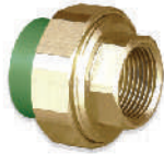
ข้อต่อยูเนียนเกลียวใน ทองเหลือง 20x1/2" - 75x2 1/2" มม.