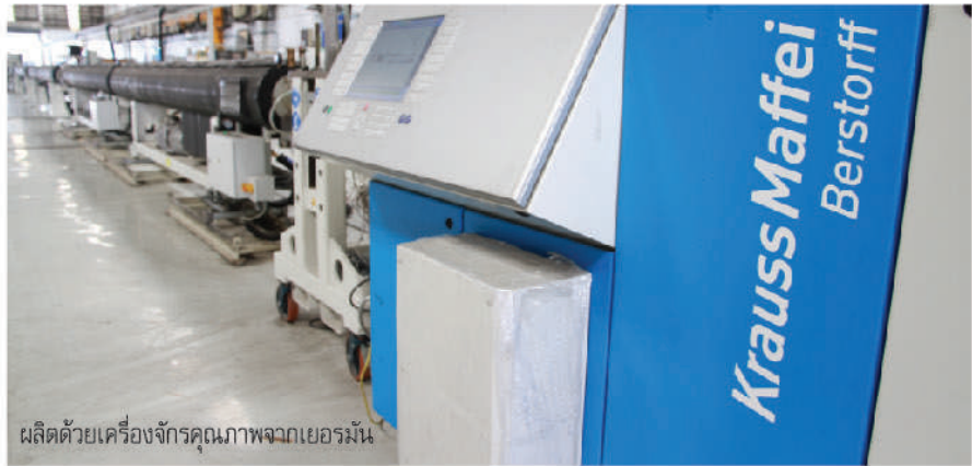
ผลิตด้วยเครื่องจักรคุณภาพจากเยอรมัน