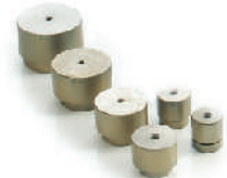
หัวเชื่อมพีพีอาร์ 20 - 63 มม. (1/2" - 2")