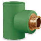
ข้อต่อสามทางเกลียวนอก ทองเหลือง 20x1/2" - 32x1" มม.