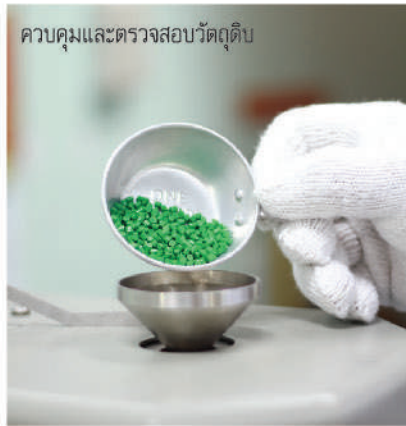
ควบคุมและตรวจสอบวัตถุดิบ

คุณภาพที่วางใจได้ ด้วยการควบคุมคุณภาพทั้งกระบวนการผลิต