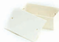
กล่องพักสายสี่เหลี่ยม 4x2 (141x50x40) สีขาว (BS) 20 มม. (1/2")