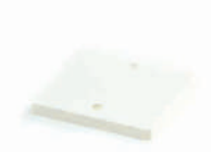
ฝาปิดกล่องพักสายสี่เหลี่ยม 4x4 สีขาว (BS) 75x75, 86x86 มม. (3x3", 3 1/2x3 1/2")