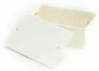
กล่องพักสายสี่เหลี่ยม 4x2 (164x77x50) สีขาว (BS) 20x2, 25x2 มม. (1/2"x2, 3/4x2")