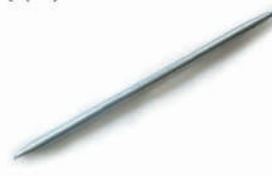
สปริงตัดท่อ-ร้อยสาย สีขาว (BS) 16-32 มม. (3/8"-1")