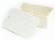
กล่องพักสายสี่เหลี่ยม 4x2 (164x77x38) สีขาว (BS) 16x2, 20-25 มม. (3/8"x2, 1/2", 3/4")